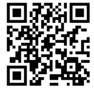
生涯学習講座 申し込み専用フォーム